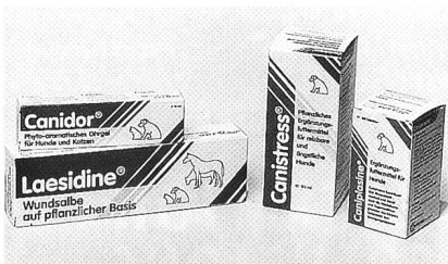
Provet AG 3421 Lyssach Tel. 034 445 40 66

Die Wirkung der neuen Produkte CANIDOR , CANISTRESS , CANIPLASINE und LAESIDINE beruht vor allem auf pflanzlicher Basis . CANIDOR , das phyto-aromatische Ohr-Gel für Hunde und Katzen, enthält 8 verschiedene Pflanzen mit z.T. synergistischer Wirkung. Wer nicht jedes Ohrproblem gleich mit Antibiotika und Steroiden angehen möchte, findet in CANIDOR ein geeignetes Produkt, dessen reinigende und desodorierende Wirkung seit langer Zeit erprobt und bekannt ist. Für ängstliche und reizbare Hunde steht bei stressigen Umständen und lärmigen Anlässen CANISTRESS zur Verfügung. CANIPLASINE , ein Futterzusatz auf pflanzlich-homöopathischer Basis, regeneriert und unterstützt den Organismus des Hundes in verschiedenen Lebensphasen. Die aus 4 Pflanzenextrakten bestehende Wundsalbe LEASIDINE vervollständigt das Quartett der 4 neuen Produkte, die in jeder Tierarztpraxis ihre guten Dienste leisten können . Natürliche, pflanzliche Produkte wirken praktisch ohne schädigende Nebenwirkungen und erfreuen sich deshalb mehr und mehr grosser Beliebtheit. Fordern Sie weitere Informationen an.