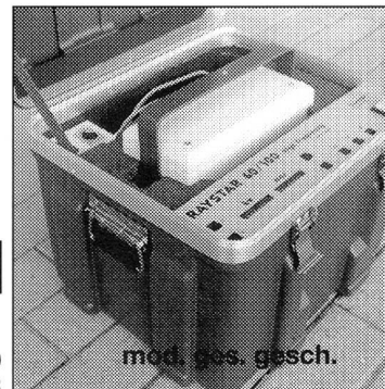
mod. ges. gesch.