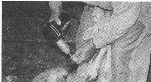
LEISTER beim Trocknen und Desinfizieren. Zur Bekämpfung der Klauenfäule.