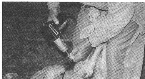
LEISTER beim Trocknen und Desinfizieren. Zur Bekämpfung der Klauenfäule.