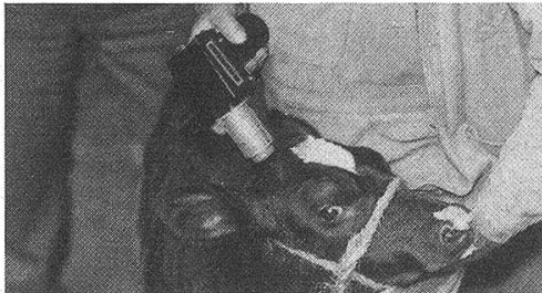
LEISTER beim Blockieren des Hornwachstums bei Kälbern.

Heissluft bis 600 °C elektronisch regelbar, erzeugt das «LEISTER-GHIBLI». Brauchbar für 30 hochinteressante Anwendungsgebiete.