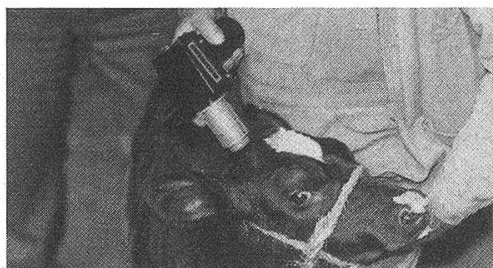
LEISTER beim Blockieren des Hornwachstums bei Kälbern.

Heissluft bis 600 °C elektronisch regelbar, erzeugt das «LEISTER-GHIBLI». Brauchbar für 30 hochinteressante Anwendungsgebiete.