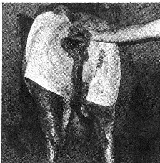
Fig. 2 Après l'extraction d'un nouveau segment, une partie meurtrie apparaît.

(fig. 2). Cette dernière constatation rend le pronostic de l'entérectomie plus favorable et nous passons aussitôt aux préparatifs de l'opération.