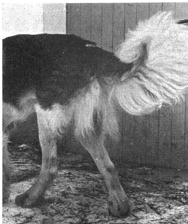
Fig. 5 Présentation de l'arrière-main dix jours après la seconde intervention.