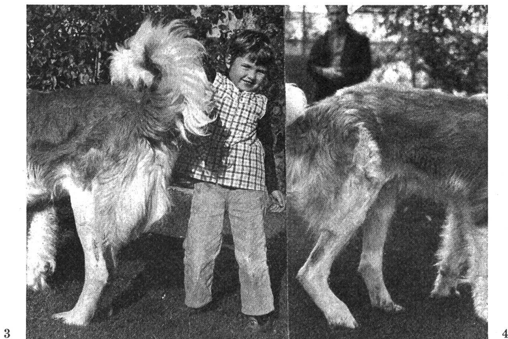
Fig. 3 Jarret gauche opéré; ceci avant l'intervention de droite.