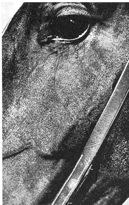
Dasselbe Tier nach Abheilung der Veränderungen

das Breitspektrum- Antimykotikum mit den überzeugenden Eigenschaften: