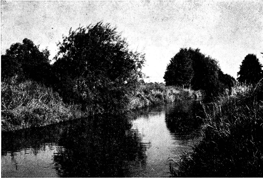
Abb. 2 Brutgewässer von Boophthora erythrocephala (Die Glatt bei Schwerzenbach).

eine starke Verkräutung durch Schilfrohr, Kalmus- und Laichkrautgewächse sowie andere Pflanzen, deren Blätter zum Teil im Wasser flottieren. Der Grad der Verschmutzung mit organischem Material ist sehr hoch, da große Planktonmengen aus dem Greifensee in das Gewässer gelangen.