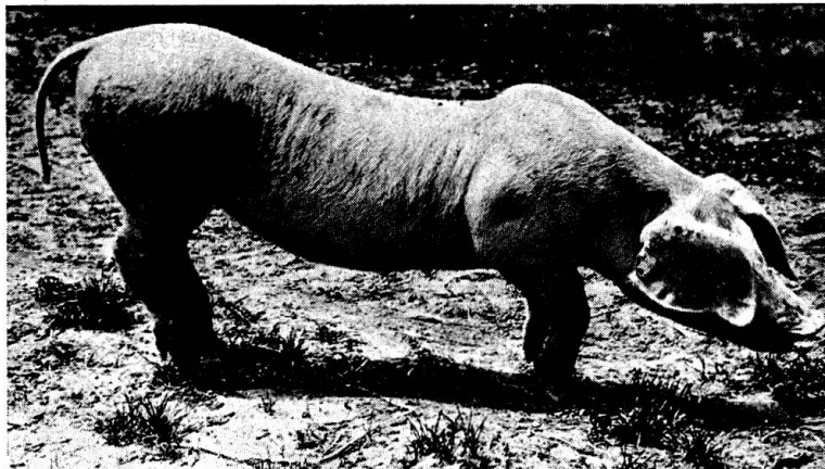
Abb. 4 3½ Monate altes Läuferschwein mit charakteristischen Spätsymptomen der Benigen Enzootischen Parese: Deutliche Ellbogen- und Karpalbeugehaltung, steile Stellung in den Fesselgelenken, Einsacken des Rückens und Bildung eines Hängebauches.

Es handelte sich um vaskuläre und perivaskuläre Infiltrate mit lymphoiden Elementen und vereinzelt Plasmazellen. Außerdem fanden sich auch im Parenchym stellenweise lockere, gelegentlich auch kompaktere Herdchen, die sich teils aus den obgenannten Infiltratzellen und teils aus sogenannter Mikroglia zusammensetzten. Die Veränderungen waren über das ganze ZNS verteilt und vorwiegend, aber nicht ausschließlich in der grauen Substanz lokalisiert. Sie ließen sich sowohl in der Großhirnrinde als auch im Hirnstamm