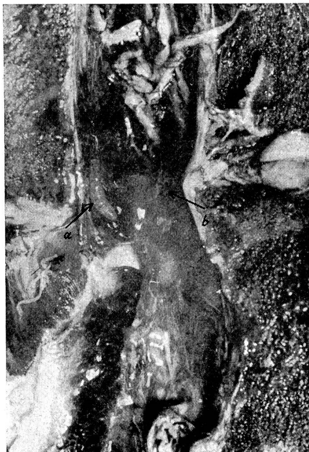
Abb. 2 Der nach der Schlachtung des in Abb. 1 dargestellten Tieres geöffnete Wirbelkanal, in dem eine Dassellarve (a) sowie blutigsulzige Veränderungen im periduralen Fettgewebe (b) sichtbar sind.