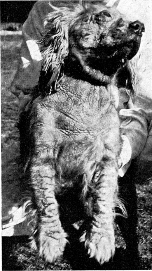
Abb. 1 Hyperkeratose