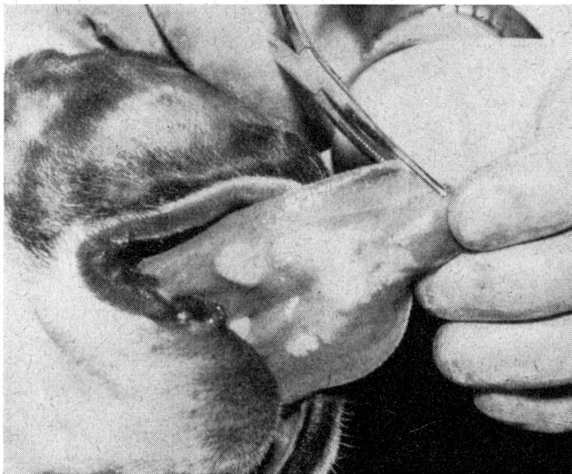
Abb. 6 Haut- und Zungenkalzinose

der Zunge zeigte Kalkablagerungen. Das Blut-Kalzium-, -Phosphor- und -Magnesium-Verhältnis war in allen Fällen ganz unverändert.