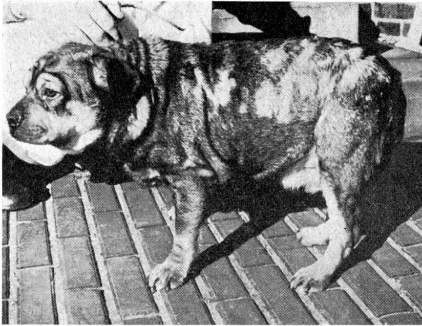
Abb. 2 Hypothyrose (Haarausfall, Myxedem)

rosen wurden zum Beispiel häufig im Verlaufe von einigen spezifischen Dermatosen festgestellt. Haarausfall, Myxödem und Acanthosis nigricans sind die üblichen klinischen Erscheinungen. Für die Feststellung der mangelhaften Tätigkeit der Schilddrüse haben sich radiumaktive Jod-Proben als sehr geeignet erwiesen. Die Werte der normalen und der veränderten Tätigkeit der Schilddrüse sind sehr sorgfältig ausgearbeitet und veröffentlicht worden. Die Cholesterol-Probe kann nur als diagnostische Hilfsprobe für den klinischen Gebrauch verwendet werden, jedoch ist diese Probe nicht ganz verlässlich für die genaue Beurteilung der Schilddrüsentätigkeit.