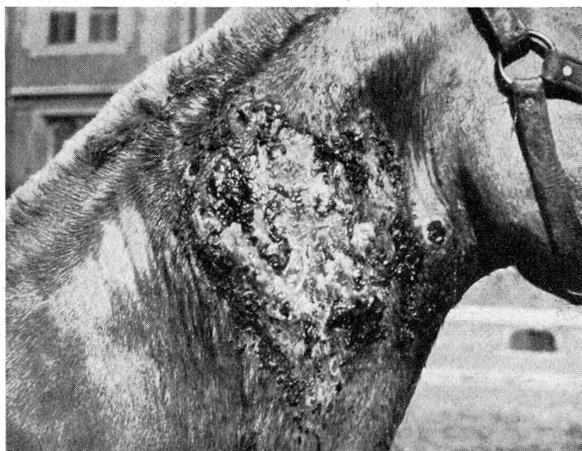
Abb. 7 Nokardiose

Für die klinische Beurteilung der Wirkungsfähigkeit der örtlich oder parenteral verwendeten Arzneien für die Behandlung verschiedener Dermatomykosen sollen nur Tiere, die die Krankheit natürlich entwickelten, ausgesucht werden. Die Behandlungsversuche, die an künstlich infizierten Tieren vorgenommen wurden, haben sich sehr häufig als unverlässlich erwiesen, da ihre vollkommene Heilung auch ohne jede Behandlung geschah.