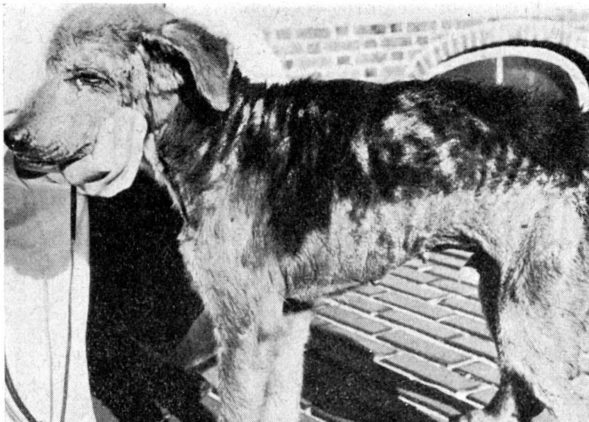
Abb. 3 Ekzematöse Dermatose im Verlaufe einer Sertoli-Zellen-Geschwulst

Im Verlaufe von pathologischen Veränderungen der Eierstöcke treten verschiedentlich Hautstörungen auf, je nach der Tätigkeit der Eierstöcke. Die mangelhafte oder ganz eingestellte Tätigkeit ist durch Haarausfall und trockene, squamöse, krustöse Dermatosen charakterisiert. Die Lokalisation derselben entspricht der durch Inkretionsstörungen der männlichen Gonaden verursachten Hautveränderungen.