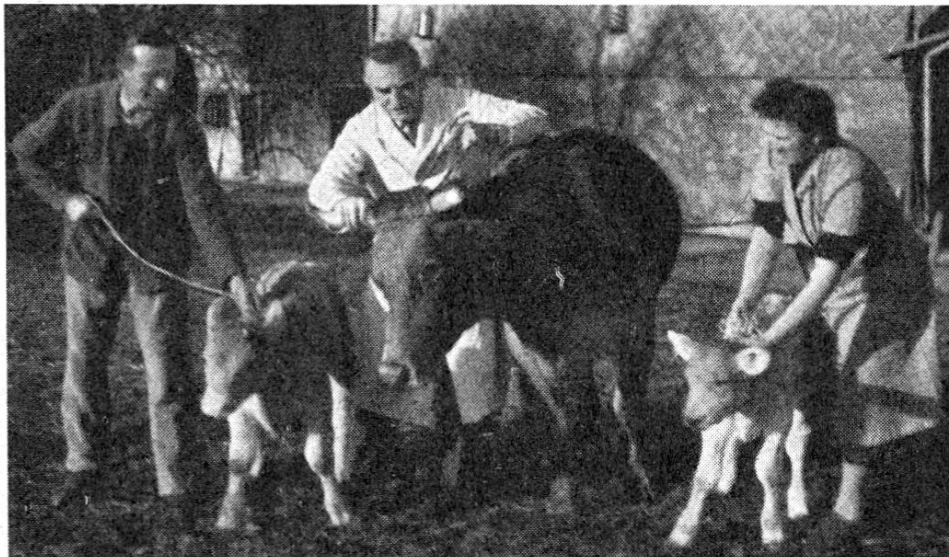
Zwillinge Links: Simmentalerkalb Rechts: Braunes Kalb

Der Landwirt A. B. in M. hatte die 8jährige, braune Kuh «Gretli» MM 2575 Mels, die schon längere Zeit unträchtig geblieben war, am 20. März 1955 um 9 Uhr vormittags von einem Zuchtstier der Braunviehrasse und eine Stunde später durch einen Simmentalerstier decken lassen. Beide männ-