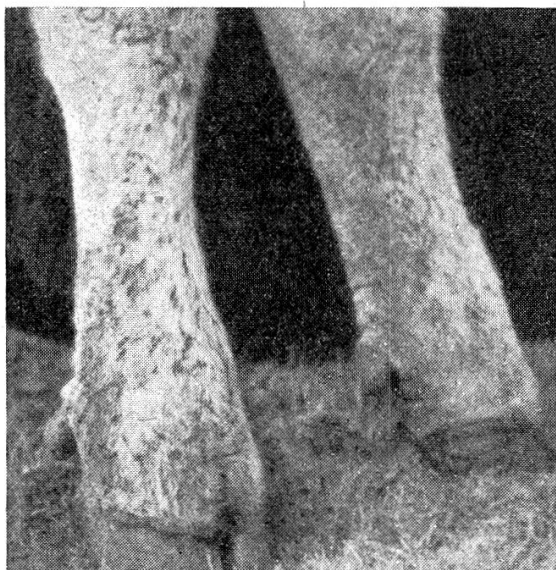
Abb. 1. Kuh Agra : Hintergliedmaßen geschwollen, vermehrt warm, schmerzhaft, überall mit kleinen, rötlichen Krusten bedeckt.

Fütterung traten keine Fälle mehr auf. — Durch das Kochen wird Solanin extrahiert, vgl. Fröhner-Völker [28], deshalb sollte das Siedewasser nicht mitverfüttert werden, sonst treten Schädigungen auf, was auch Meyer zu Knolle [76] bestätigt.