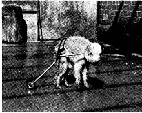
Abb. 3. Fahrgestell für Hund mit Nachhandparese (Kleintierklinik).