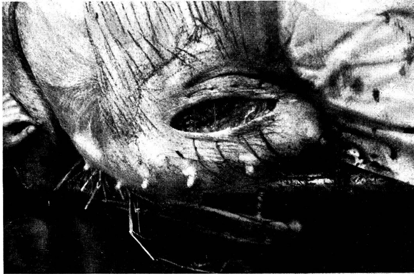
Abb. 2. Kaiserschnitt beim Schwein: Haut-Muskelnähte vor dem Verschuß (Rinderklinik).

Das Problem der künstlichen Besamung wird an der Rinderklinik in Hannover auf Grund des russischen Vorbildes schon seit 1933 studiert und bearbeitet. Heute wird an der Hochschule mit finanzieller Unterstützung der USA eine Besamungsstation mit 25—30 Zuchtstieren eingerichtet, die für eine Besamungsgenossenschaft mit ca. 12 000 Kühen dienen soll. Prof. Götze selbst setzt sich für eine langsame Entwicklung der KB ein, erachtet diese aber als unbedingt notwendig für die Weiterentwicklung der Rinderzucht. Nach seinem Dafürhalten ist die KB kein technisches Problem mehr, wohl aber ein züchterisches, dessen Auswirkungen in ungefähr 10 Jahren überblickt werden