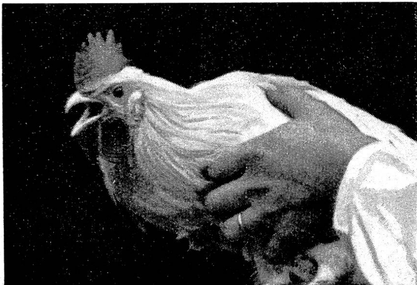
Derselbe Hahn im Inspirationsstadium.

In der zweiten Passage erzeugte das keimfrei filtrierte Material die typischen klinischen Erscheinungen und pathologisch-anatomischen Veränderungen nach einer 7tägigen Inkubation (s. Abb).