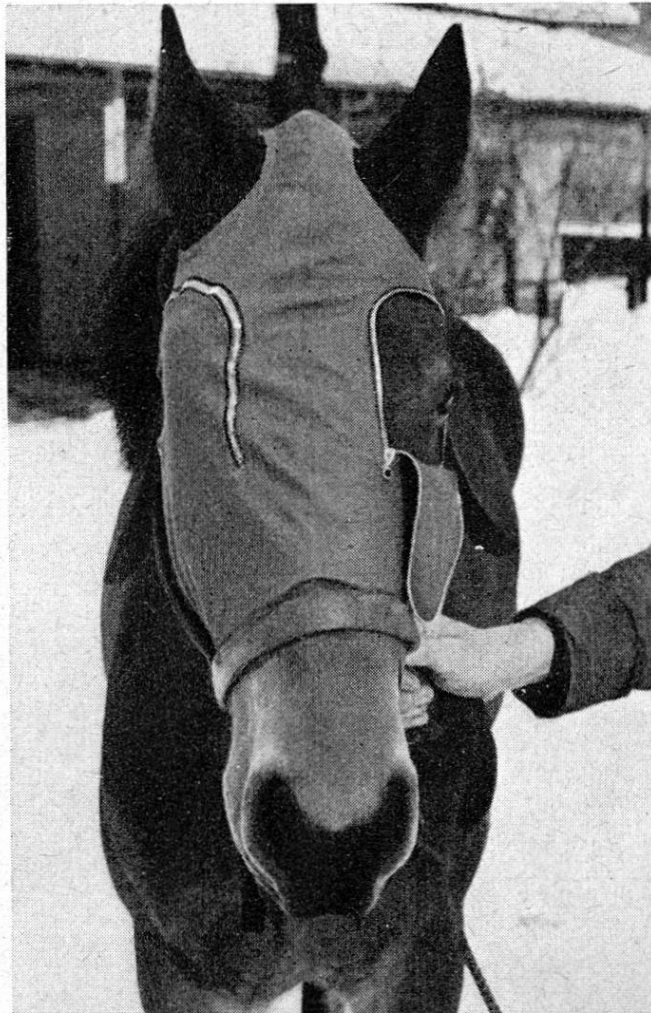
Abb. 1. Pferd mit Augenkappe für die Sehprobe.

Zu einer vollständigen Augenuntersuchung, insbesondere wenn die Sehkraft beeinflussende Augenveränderungen vorliegen, gehört die Prüfung des Sehvermögens. Allgemein wird die Sehprobe so durchgeführt, daß das Pferd mit abgedecktem gesundem Auge gegen Hindernisse, wie am Boden liegende Balken, Latten oder Stangen geführt wird. Je nachdem das Tier gegen das Hindernis stößt oder frei darüber hinweggeht, kann objektiv beurteilt werden, ob das Sehvermögen des Auges vorhanden oder aufgehoben ist. Eventuell kann es als nur vermindert bezeichnet werden, wenn das Pferd das Hindernis zögernd überschreitet.