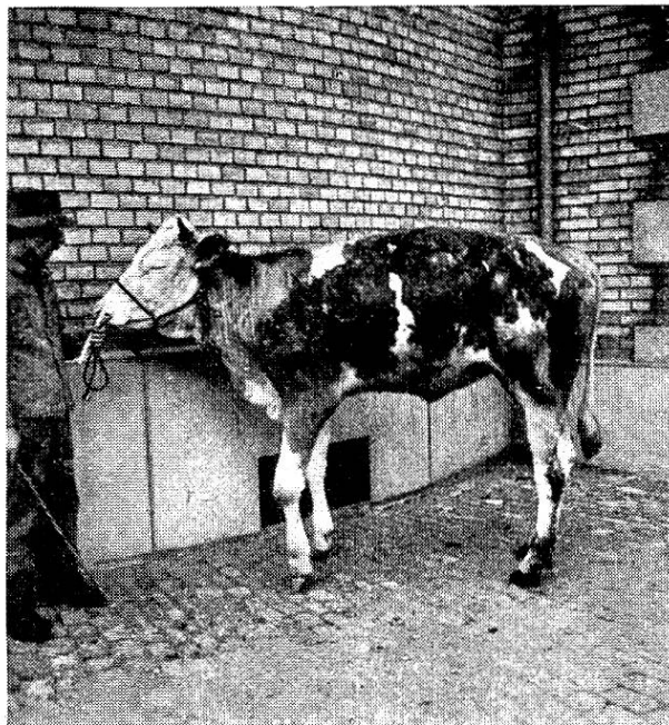
Rind Simmentalerrasse, 1½ jährig. Hochkrümmen des Rückens, Vorbiegigkeit, steile Fesselstellung, Auftreibung der Karpalgelenke. Diagnose: Osteoarthritis chronica deformans beider Karpalgelenke.

Auf der andern Seite kann man auch diejenigen Fälle, bei denen die ausgesprochensten Veränderungen an den Hintergliedmaßen zu beobachten waren, zu einem ziemlich scharf abgrenzbaren Krankheitsbild zusammenstellen. Hauptsymptome sind hier starke Spannung der Achillessehne, maximale Streck-