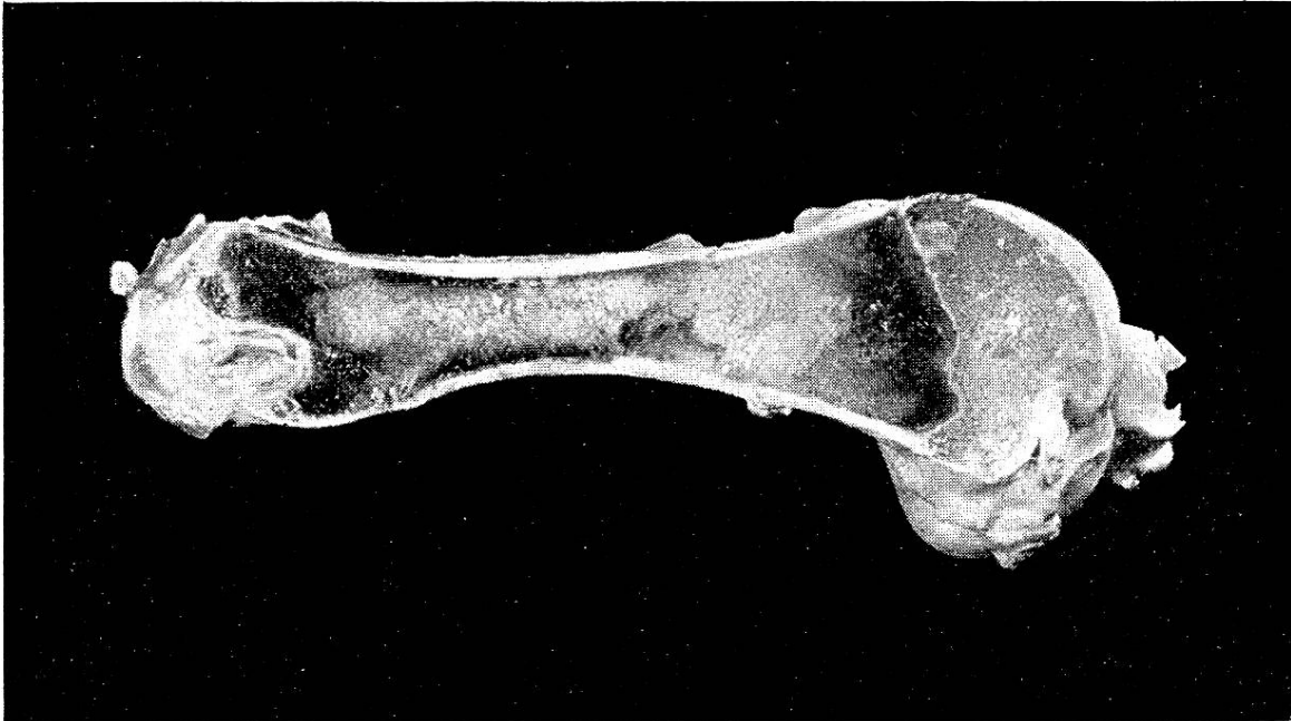
Abb. 2. Femur des gleichen Rindes, wie Abb. 1, hochgradige Osteoporose.