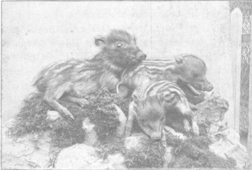
Junge Wildschweine, wovon 2 je dreiwöchig, das grössere fünf Wochen alt.

kamen. Diese letzteren waren gerade ein Pärchen, gut gewachsen und ausserordentlich lebenskräftig, und zeigten bei schwarzer Grundfarbe des Körpers, weissem Vorkopf und hellen Unterfüssen, vom Hals bis zum Hinterteil scharf