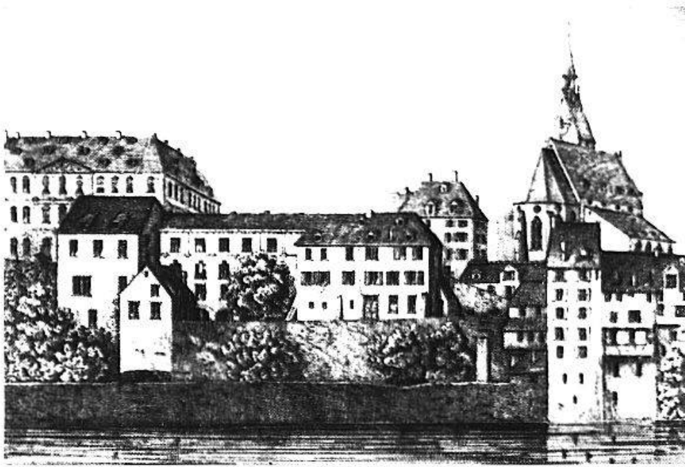
Fig. 5. C'est dans des conditions misérables que Miescher accomplit la seconde étape de ses recherches sur le noyau cellulaire. La Vieille Université que l'on voit ici sur une gravure d'époque, abrita ainsi la découverte de la protamine.

exemple, on a pêché plus de 2500, soit environ 30 t de ces poissons de 1 m de long et d'un poids voisin de 12 kg. A Bâle, un décret de la fin du 18 e siècle interdisait d'ailleurs de servir ce poisson plus de 4 fois par semaine aux gens de maison! Ses premiers saumons, Miescher se les procura en allant les pêcher lui-même de bon matin au pied de la vieille université. Pour ce faire, on laissait descendre les «Salmewog» dans l'eau et on les remontait à la force des bras (Fig. 4). On peut encore voir aujourd'hui un tel «Salmewog» entre la vieille université et la «Pfalz». Peut-être est-ce celui qu'utilisait Miescher pour ses parties de pêche matinales.