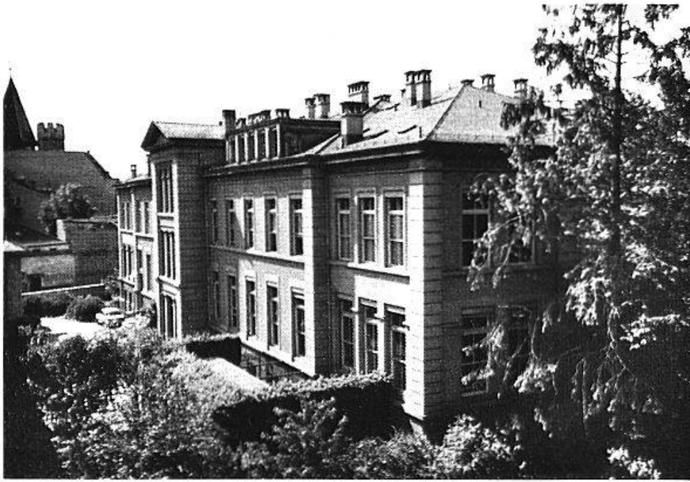
Fig. 6. Titulaire de la chaire de physiologie depuis 1872, Johannes Friedrich Miescher obtint en 1882 les crédits nécessaires à la construction d'un Institut de Physiologie: le Vesalianum. Il y organisera en 1889 le premier congrès international de physiologie.

respiration. Reprenant le thème de sa leçon inaugurale de 1871, il publie enfin un article dans lequel il attribue pour la première fois le rôle d'excitateur des mouvements respiratoires, au gaz carbonique. A ses moments perdus, il reprend aussi ses analyses de la nucléine. De bon matin, dans le froid le plus rigoureux, insuffisamment vêtu, ne s'alimentant presque plus, ne dormant plus non plus, épuisé physiquement et nerveusement, il travaille avec acharnement. Le résultat ne se fait pas attendre. Un mauvais catarrhe qu'il néglige dégénère en tuberculose au printemps 1894. Il a 50 ans.