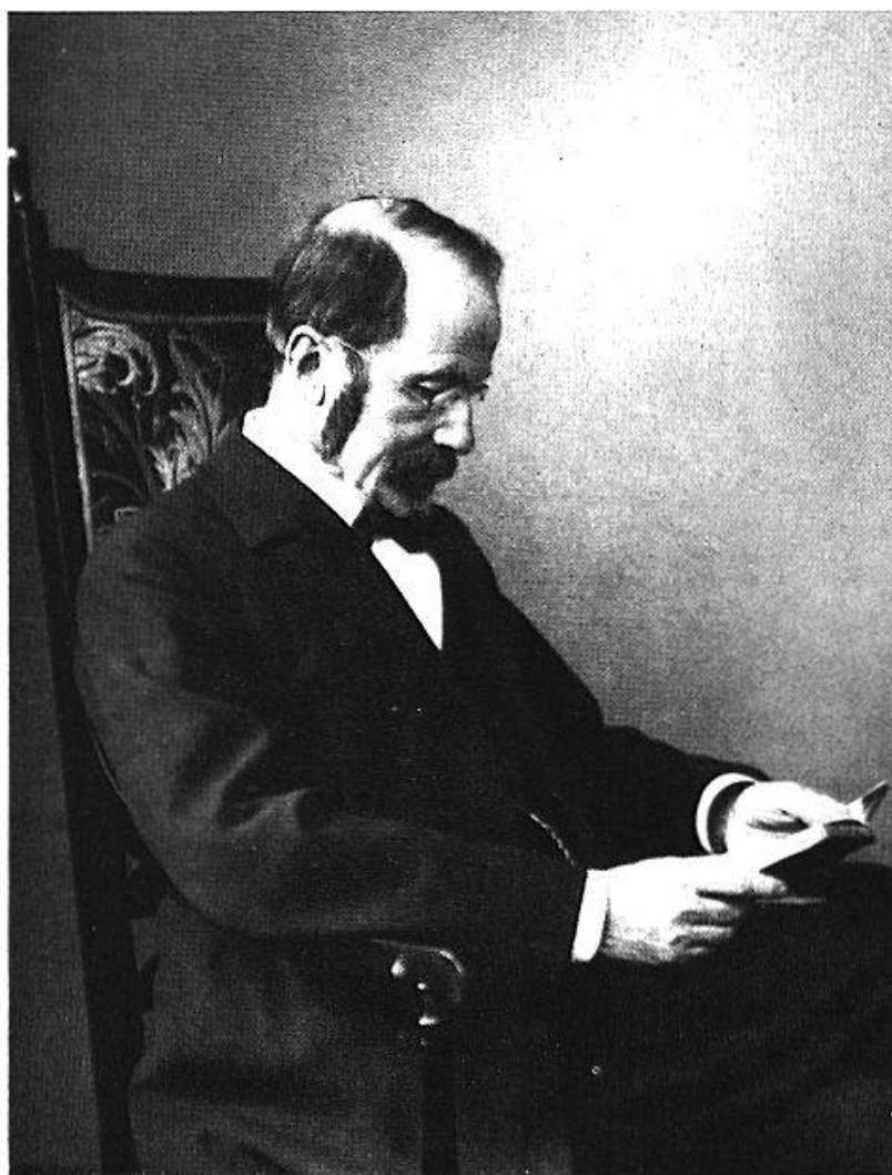
Fig. 7. La personnalité de Wilhelm His ne peut être dissociée de la vie scientifique de Johannes Friedrich Miescher. Ce dernier ne publia que fort peu. Sans Wilhelm His et ses élèves, son œuvre ne serait probablement jamais sortie de l'ombre.