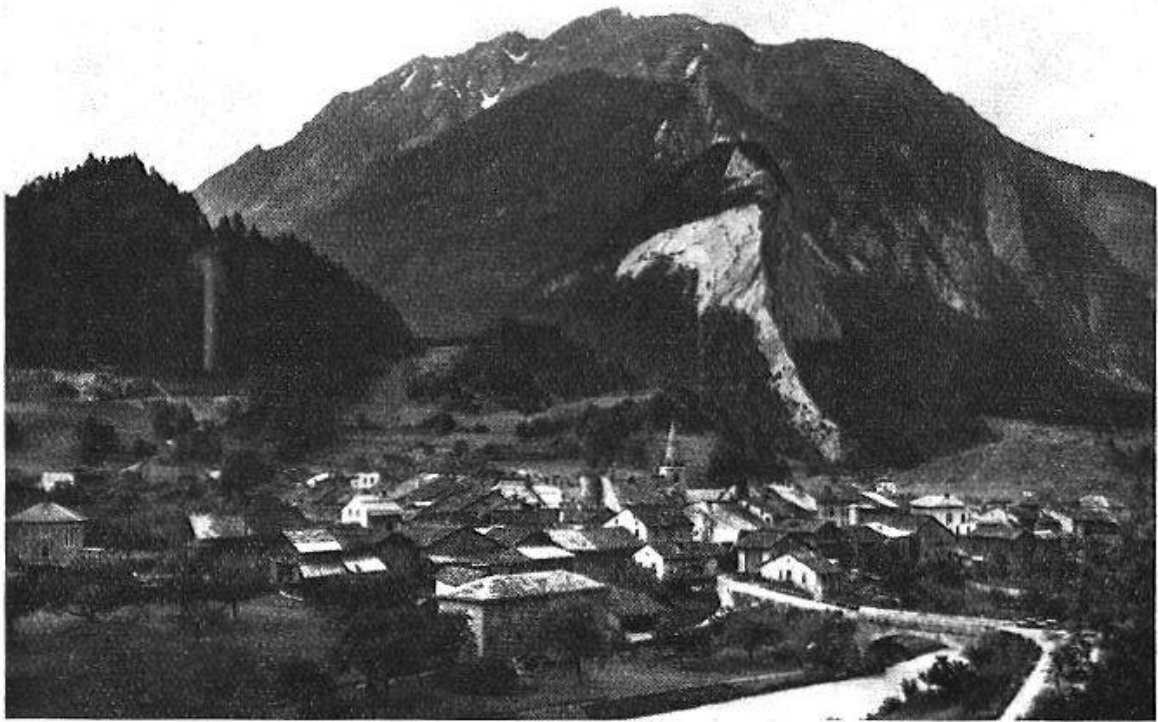
Fig. 2. Vue générale de Sembrancher au pied du Mont Catogne. Le flanc sud-est de cette montagne granitique est partiellement recouvert de gneiss et calcaires dolomitiques qui forment une arête abrupte. Le filon de fluorine est pincé entre le granit et le gneiss. On l'a identifié dans le haut de la combe à droite de cette arête. Les sources de La Garde sont masquées par le mamelon boisé à gauche de cette arête. Les sources du Devin et des Trappistes jaillissent au pied des forêts dans les éboulis à droite.