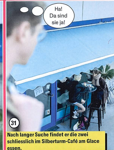
31 Nach langer Suche findet er die zwei schliesslich im Silberturn-Café am Glace essen.