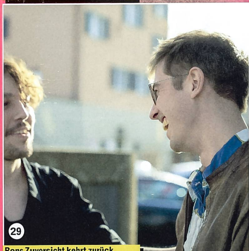
29 Rons Zuversicht kehrt zurück.