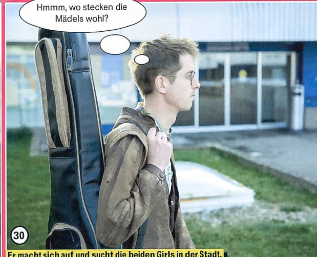
30 Er macht sich auf und sucht die beiden Girls in der Stadt.