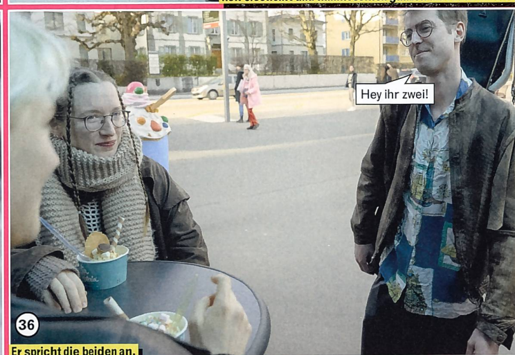
36 Er spricht die beiden an.