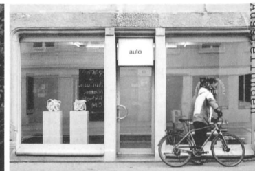
Dokustation Heimspiel 2024

Ausstellung bis 2. Februar, Kunst(Zeug)Haus Rapperswil-Jona. kunstzeughaus.ch