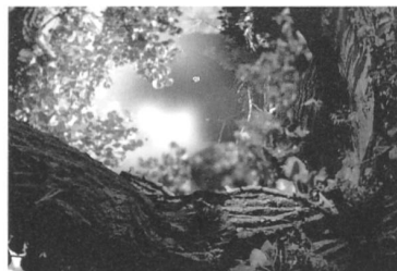
Denn in den Wäldern sind Dinge....