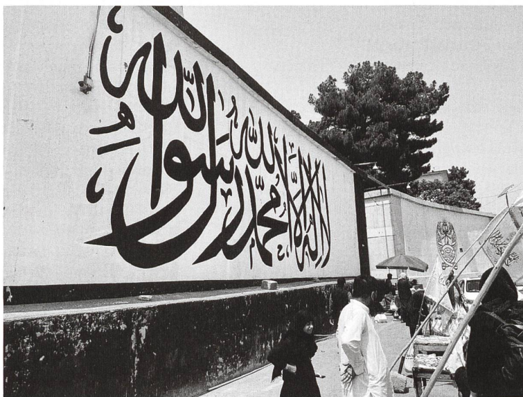
oben: Mit ihrer Flagge markieren die Taliban überall in Kabul Präsenz. unten: Wenns im Land noch irgendwo Geld gibt, dann hier: der grösste Geldwechselmarkt des Landes.

Doch erst einmal begegnet uns wieder die grosse Armut im Land: Überall hat es Kinder, Frauen und Alte, die irgendwie Geld verdienen wollen. Sei es mit Papiertaschentüchern, mit Wasserflaschen oder indem sie an Strassenkreuzungen