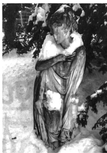
Sappho 2021 im Park ...