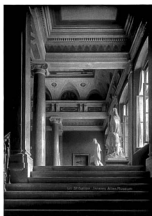
... und 1921 im Foyer des Kunstmuseums.