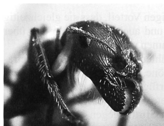
Kopf einer Ameise

Unter Menschen ist aktuell viel von partizipativen Prozessen die Rede, von Soziokratie und Sozialkompetenz, von Schwarmintelligenz, flachen Hierarchien, Sharing-Modellen.... Mein Ameisenbüchlein (in der Reihe «Wissen» beim Verlag C.H.Beck erschienen) spricht von «Ordnung ohne Obrigkeit», verweist auf das Erbgut als hauptsächlichen Informationsträger, auf die diversen Ausprägungen der Arbeitsteilung (bis hin zu «Faulenzerinnen», die es auch bei den Ameisen gebe), und schliesslich auf die Pheromone: die Verständigung mittels chemischer Botenstoffe, die bei Gefahr oder dem Auftauchen von Beute oder sonstigen Ereignissen abgegeben werden. Chemi-