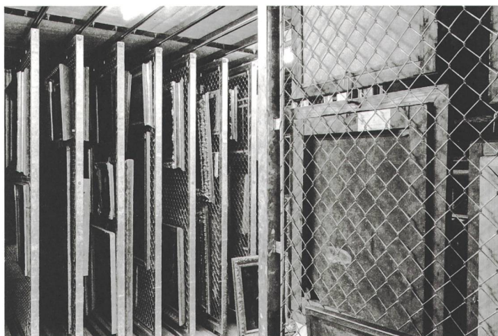
Im unterirdischen Depot des Kunstmuseums St.Gallen fotografierte Jan Thoma.