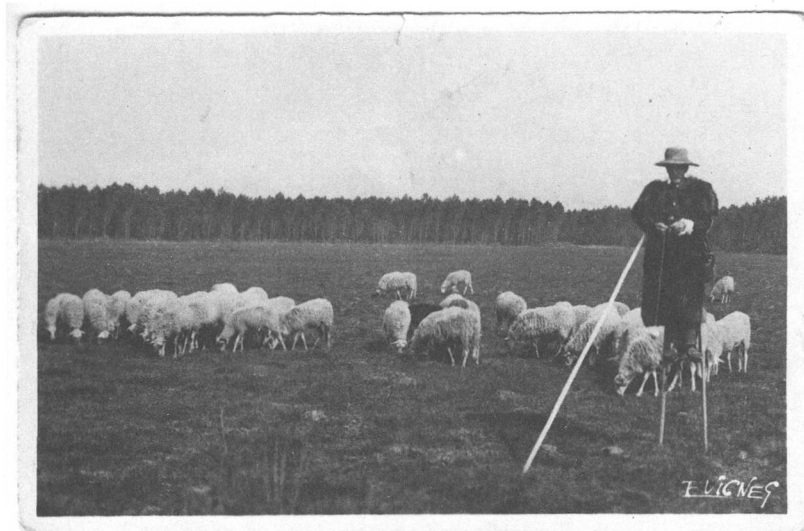
Schafhirt auf Stelzen, Frankreich, ohne Jahr. Archiv Stefan Keller.

Der Schafhändler heisst Herr Fritschi, er wohnt in einem der Dörfer am See. Muss ein Schaf geschlachtet werden, dann holt er es ab. Von Zeit zu Zeit bringt er uns einen jungen Bock und nimmt den alten in Zahlung dafür. Die Lämmer züchten wir selber.