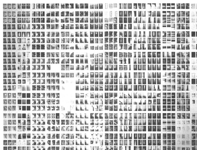
Annina Frehner: Index No 1 .