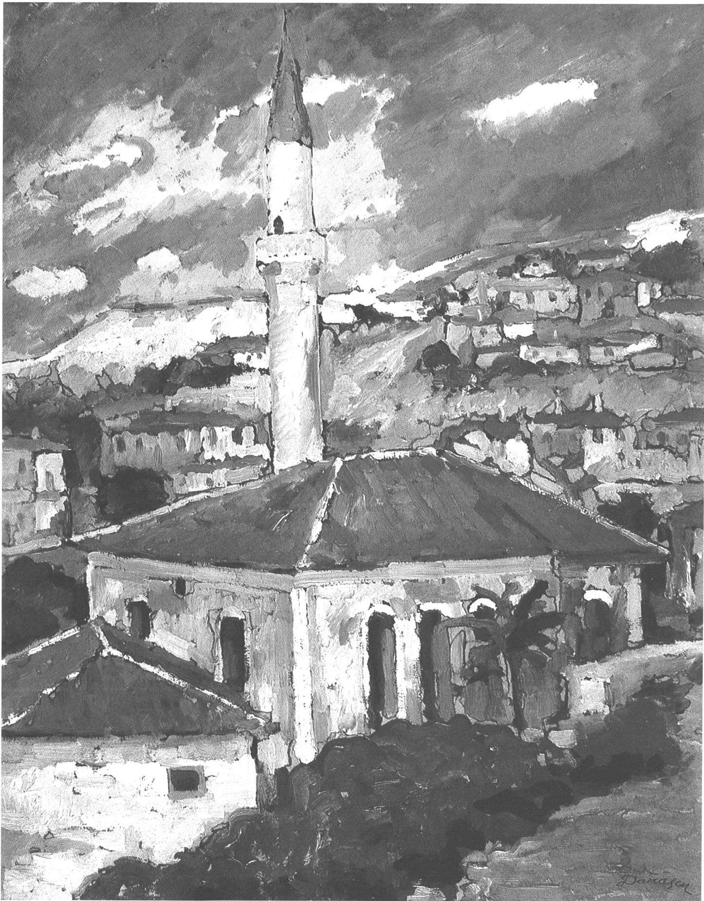
Nicolae Darascu (1883–1959): Ansicht von Baltchik .