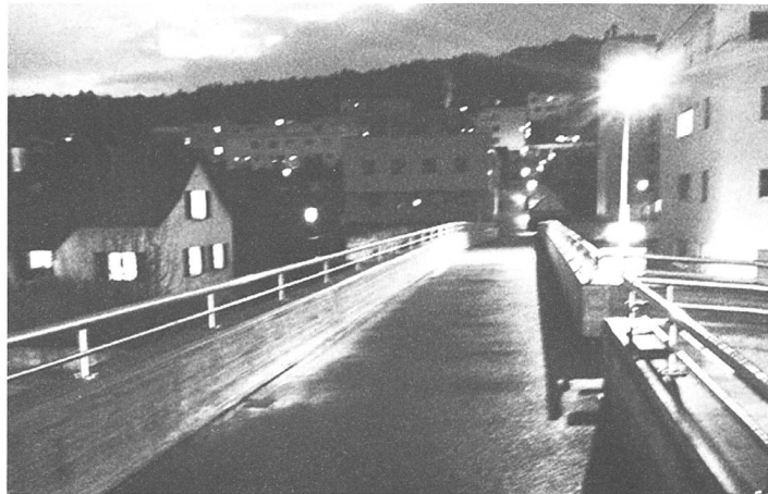
Wittenbachs Passerelle by night.

Die stattliche Passerelle über dem am Zentrum vorbeibrausenden Penderstrom wäre übrigens ein Kulturort der Sonderklasse. Einige Spintisierereien dazu haben wir schon auf saiten.ch probiert, unter dem Titel Willkommen in Wittentown : «Grosszügig dimensioniert, breit und ausladend schwingt sich die Passerelle göttlich über die Ausfallstrasse Richtung Amriswil. Ein Hauch von USA in der Ost-Provinz. Das hat sonst niemand. Nimmt man noch das Platzgeviert hinzu, das sich zwischen Migros, Spar und Post daran anschliesst, ein Märchenprinz von einem Platz ... dies zusammengedacht, Wunderampe und Dornröschenplatz, könnte zum Kult-Ort werden: für Rampenfeste, für Platzkonzerte, für Spontan-Lesungen im vor sich hin dämmernden Pavillon, für Schach- und Jassturniere hoch über dem tosenden Verkehr, für alles Mögliche, brückensymbolisch Bevölkerungsschichten und Altersgruppen verbindend, Wittentown.»