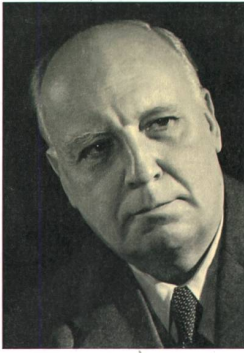
Oskar Reinhart, 1945