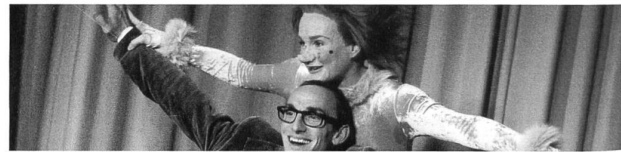
Inszenierungskonzept: TCG-Hafen Senn Stieger, St.Gallen

Samstag 24.09 19.30 Premiere Freitag 30.09. 20.00