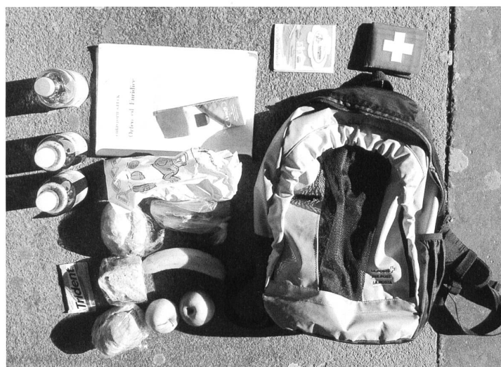
Remo Sprecher *1990

Auf dem Weg zum Einkauf. Hat immer viele weitere Taschen in ihrer Tasche, denn so lässt sich auch eine überfüllte Tasche ordnen.