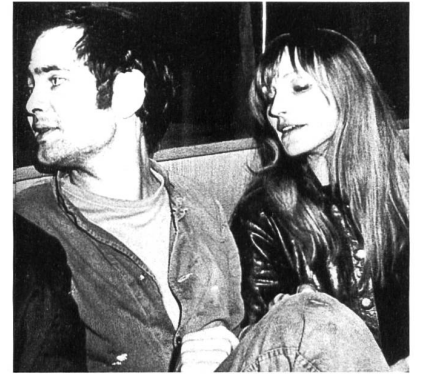
Andreas Baader und Gudrun Ensslin im Oktober 1968 während dem Gerichtsprozess zum Kaufhausbrand in Frankfurt.

Die Vorgeschichte zum «Frankfurter Kaufhausbrand» ist komplex. Als im Mai 1967 in einem Kaufhaus in Brüssel ein Grossbrand ausbrach, wurden mehr als 250 Menschen getötet und Hunderte verletzt. In den folgenden Tagen verteilte die «Kommune 1» in Ber-