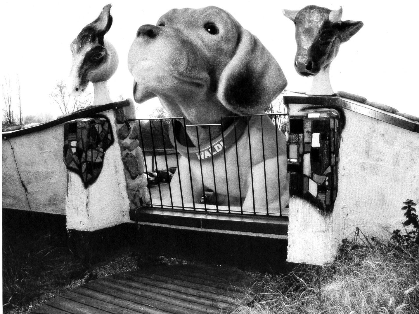
Als kurz nach der Filiale in Weinfelden Aldi Altenrhein eröffnete, wurde erstmals auch Wachhund Waldi gesichtet.

Harry Rosenbaum , 1951, ist Reporter für AP und «Sonntagsblick» in St.Gallen.