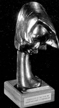
2001 Intercoiffure, Paris «Personality of the Year»