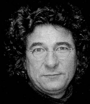
2003 St.Gallen Ihr Coiffeur

INTERCOIFFURE HERBERT. Natürlich, haargerecht, passioniert. Telefon 071 222 44 66 Oberer Graben 12, St.Gallen