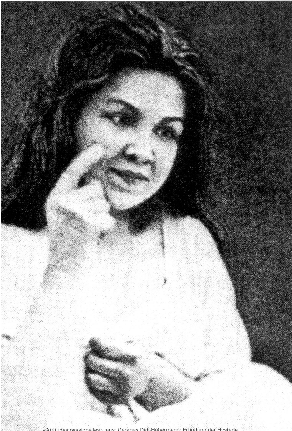
«Attitudes passionelles»; aus: Georges Didi-Hubermann: Erfindung der Hysterie

Das Verschwinden eines alten Krankheitsbildes: Hysterie