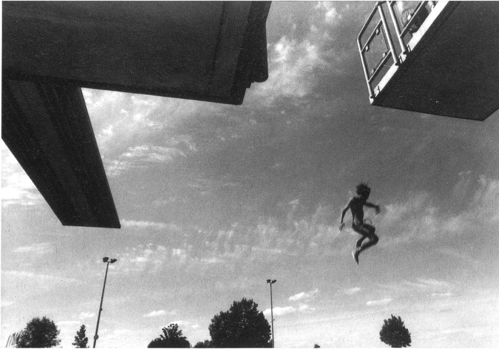
Schwimmbad Arbon, 9. Juli 1997.