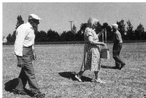
Pflügerfreunde beim 31. Thurgauer Wett-pflügen am 10. August 1997 in Bonau.

schlachtet, oder die Arbeiter in den ultrahygienischen Fabriken heutiger Nahrungsmittelproduktion. Und auch er zeigt uns Folklore und Brauchtum. Aber nicht mehr nur den Bettags-Ritt auf dem Nollen, sondern ebenso «Out in the Green» oder das türkische Ölringen mit Teilnahme von Schweizer Ringern in Wein-feldern.