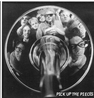
PICK UP THE PIECES