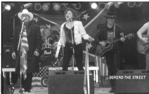
BEHIND THE STREET