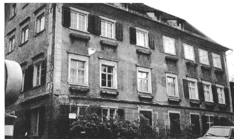
Das ehemalige jüdische Kaffeehaus in Hohenems