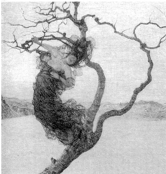
Ausstellung zu Ehren von Giovanni Segantini mit internationalen Künstlern in Goldach