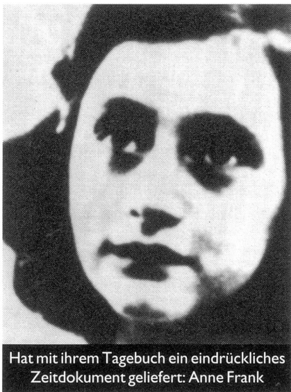
Hat mit ihrem Tagebuch ein eindrückliches Zeitdokument geliefert: Anne Frank

Vom 10. bis 30. Juni findet im Waaghaus eine umfassende Ausstellung über "Die Welt der Anne Frank" statt. In Zusammenarbeit mit der Anne-Frank-Stiftung Amsterdam zeigt die Nederlandse Vereniging Oostschweiz, "wie wir in schlechten Zeiten dazu neigen, Minderheiten als Sündenböcke abzustempeln" und schlägt damit eine Brücke auch zur schweizerischen Gegenwart.