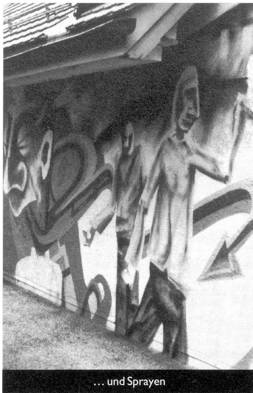
... und Sprayen

geht noch weiter: "Das ist unsere Religion. Wir sind Atheisten, das gehört bei uns dazu!" Sie würden einzig an den technischen Fortschritt glauben: "Er hilft einem, sich zu entfalten." Sie geben mir ein Bei-