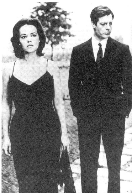
"La notte": Die Kommunikation zwischen ihnen ist unmöglich geworden. (Jeanne Moreau, Marcello Mastroianni)

Die europäischen Filmschaffenden scheinen zwanzig, dreissig Jahre nachzuhinken. Ihre Filme werden nicht mehr verstanden und nicht mehr geschätzt, weil sie sich an Qualitätsmerkmalen orientieren, die das grosse Kino der fünfziger und sechziger Jahre noch innehatte. Die Kinogänger von heute kennen diese Filme nicht