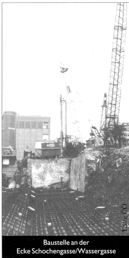
Baustelle an der Ecke Schochengasse/Wassergasse