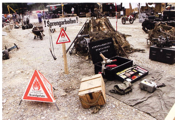
Historische Baustelle, Foto: Ebianum