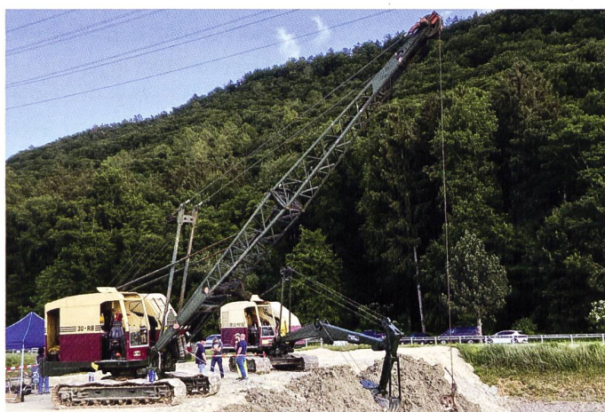
Seilbagger, Foto: Ebianum