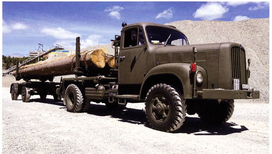
Langmatw Berna 2VM

zeigt. Bei der Baustelle sah man zudem das Strassenbauhandwerk in früheren Jahren. Auch Baumaschinen und Baufahrzeuge, welche bei der Schweizer Armee im Einsatz standen, konnten in der Sonderausstellung Genie bestaunt werden. Insgesamt wurden über 250 Objekte ausgestellt.