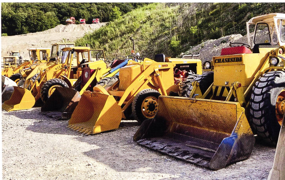
Pneulader soweit das Auge reicht.

Das angesagte Spektakel hat sämtliche Erwartungen übertroffen. So wurde der Anlass von rund 15'000 Gästen besucht. Diese waren begeistert von der Vielfalt der spektakulären Ausstellung! Ein enormer logistischer Aufwand (insbesondere Transport der Baumaschinen) war für den Erfolg mitverantwortlich. Die Weiach Historik war ein voller Erfolg und das OK zeigt sich äusserst zufrieden.