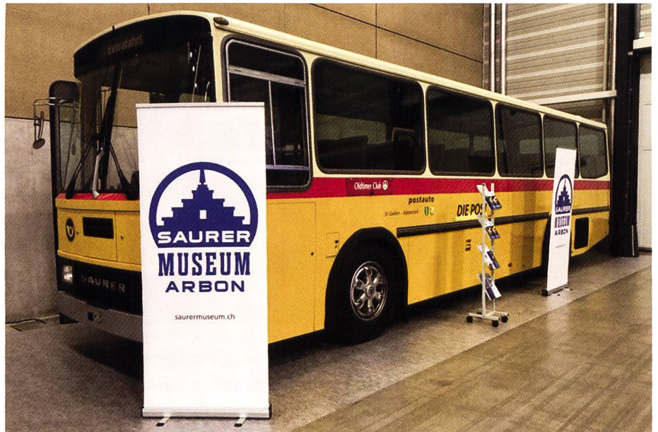
Unser RH 523-23 ist bereit und wartet an der Motorworld Classic in Luzern auf die Messebesucher.

Stellvertretend für alle Anlässe sei hier die Swiss Classic World in Luzern etwas näher beschrieben. Diese jährlich stattfindende Messe darf mit Fug und Recht als der schweizerische Marktplatz für sämtliche Anliegen der Oldtimer-Szene bezeichnet werden und vermag Jahr für Jahr tausende Oldtimer-Begeisterte anzuziehen. Nebst zum Verkauf stehender Oldtimer-Automobile und Motorrädern aller Marken werden in den Messehallen Luzern auch Zubehör, wie Bekleidung, Ersatzteile, Markenemblems etc. oder Fachbücher und Modelle sowie alle Dienstleistungen rund um die Oldtimerwelt zum Kauf angeboten. Eine ganze Halle