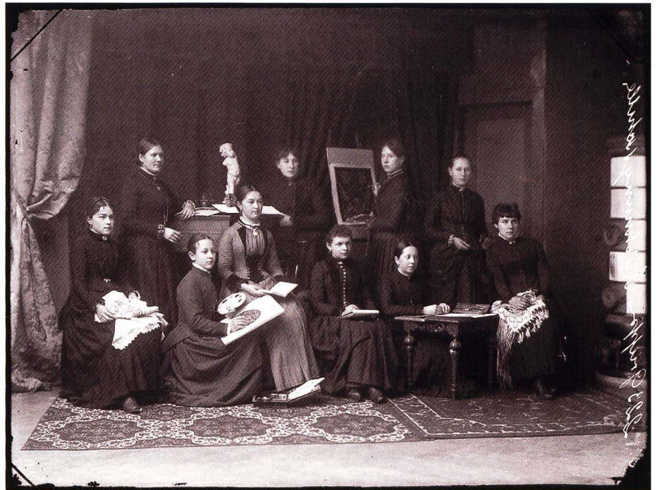
Zeichnungsschule für Industrie und Gewerbe St. Gallen, 1886

«Mädchenklasse» Jahrgang 1886 arrangierte er zu einem meisterhaften Gruppenporträt.