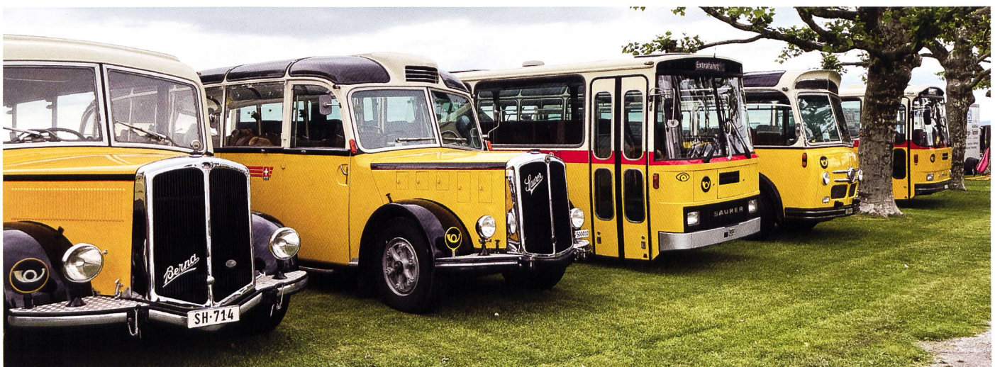
Die Postautos, diese sind ein Muss bei jeder Ausstellung. Hier eine ganze Reihe der gelben Riesen.