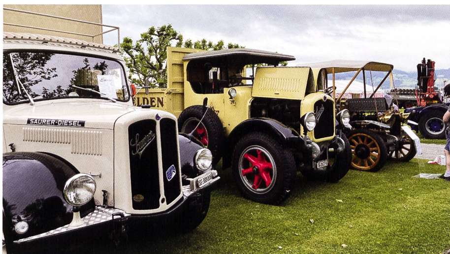
Drei Generationen Saurer