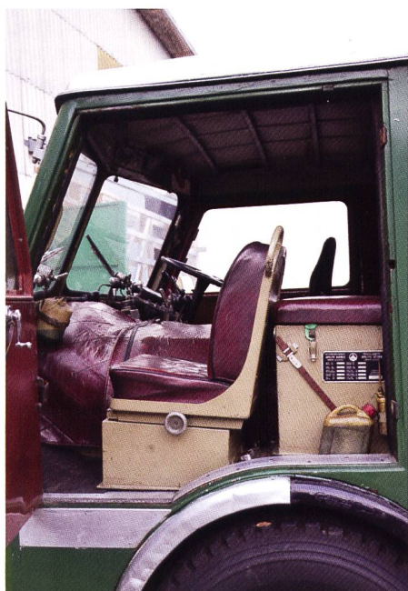
Für den internationalen Transport war die Führerkabine mit einer äusserst spartanischen Pritsche ausgerüstet.